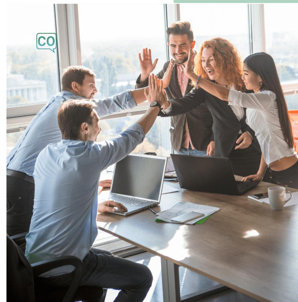
El trabajo en equipo

Comuníquense bien con su equipo para que el trabajo en equipo sea más efectivo y solidario.